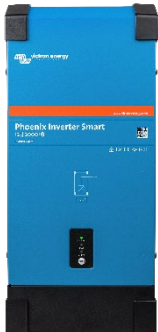
Střídač Phoenix Smart 12/2000